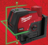
Niveau laser à faisceau vert en croix avec points d'aplomb M12 MC (3622-20) (3622-21) (ensemble)