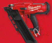
Cloueuse à charpente M18 FUEL MC à 30 degrés (outil seulement) (2745-20)