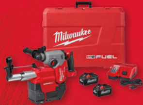
Marteau rotatif SDS-PLUS 1 po avec dépoussiéreur spécialisé H M18 FUEL MC (2912-22DE)