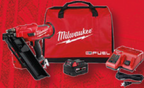
Kit de cloueuse à cadre 30 degré M18 FUEL MC (2745-21)