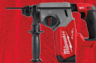
Marteau rotatif SDS Plus de 1 po M18 FUEL MC (outil seulement) (2912-20)