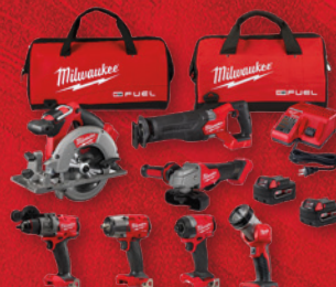
Kit 7 outils, batterie LITHIUM ION M18 FUEL MC (3697-27)