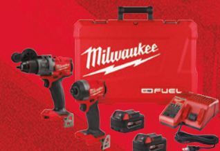
Ensemble de 2 outils M18 FUEL MC (3697-22)