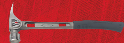
Marteau à face de frappe fraisée et à manche courbé Stiletto MD Tibone 3 (TB3MC)