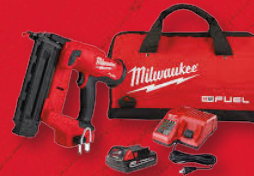
Cloueuse à finir Calibre 18, 1 X 2AH (2746-21CT)