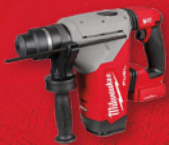
Marteau rotatif SDS-PLUS 1 1/8 po M18 FUEL MC (outil seulement) (2915-20)