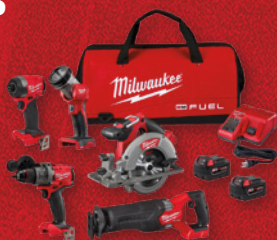
Kit 5 outils, batterie LITHIUM ION M18 FUEL MC (3697-25)