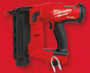
Cloueuse pour petits clous de finition de calibre 18 M18 FUEL MC (outil seulement) (2746-20)