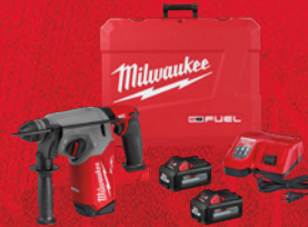
Ensemble marteau rotatif de 1 po SDS Plus M18 FUEL MC (2912-22)