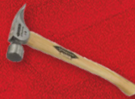
Marteau 14oz oreilles droites Stiletto (T114MC)