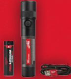
Lampe de poche USB, DEL 1100 lumens (2161-21)