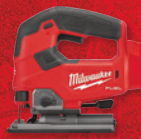
Scie sauteuse à poignée en D M18 FUEL MC (outil seulement) (2737-20)