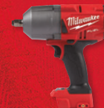
Clé à chocs à couple élevé de 1/2 po M18 FUEL MC avec anneau de friction (outil seulement) (2767-20)