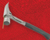
Marteau 14oz, oreilles droites, manche courbé Stiletto (TBM14RMC)