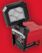
Lumière DEL 1500 lumens M18 (2365-20)