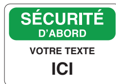
PICOVID9F3VY 10x14" - 250x355 mm PICOVID9F2VY 7x10" - 180x250 mm