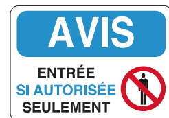
PICOVID7F3VY 10x14" - 250x355 mm PICOVID7F2VY 7x10" - 180x250 mm