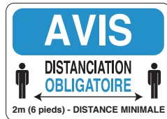
PICOVID2F3VY 10x14" - 250x355 mm PICOVID2F2VY 7x10" - 180x250 mm