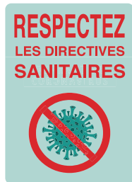
PICOVID1F3VY 14x10" - 355x250 mm PICOVID1F2VY 10x7" - 250x180 mm