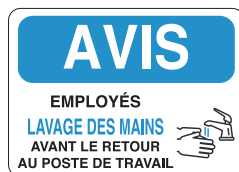
PICOVID5F3VY 10x14" - 250x355 mm PICOVID5F2VY 7x10" - 180x250 mm