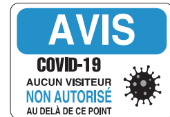
PICOVID4F3VY 10x14" - 250x355 mm PICOVID4F2VY 7x10" - 180x250 mm