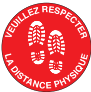
PICOVID11F 18" - 460mm