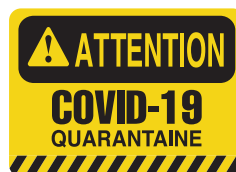
PICOVID6F3VY 10x14" - 250x355 mm PICOVID6F2VY 7x10" - 180x250 mm