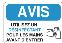
PICOVID10F3VY 10x14" - 250x355 mm PICOVID10F2VY 7x10" - 180x250 mm