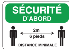
PICOVID3F3VY 10x14" - 250x355 mm PICOVID3F2VY 7x10" - 180x250 mm