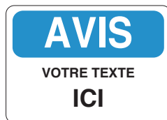
PICOVID8F3VY 10x14" - 250x355 mm PICOVID8F2VY 7x10" - 180x250 mm