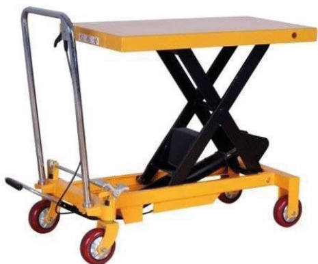
TABLE ÉLÉVATRICE MOBILE