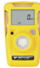
DÉTECTEUR MONOGAZ BW CLIP REAL TIME